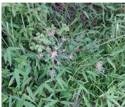
Hojas de pituitaria ( delphinium )

Se utiliza aceite de oliva, una planta llamada pituitaria esto se coloca en una tasa de agua hervida y se agrega la hojas de la pituitaria más 2 gotas de aceite de oliva y se deja estrojar, se bebe una taza por la noche, teniendo en cuenta que no se tomar muy caliente ya que pierde su esencia y su efecto no es igual.