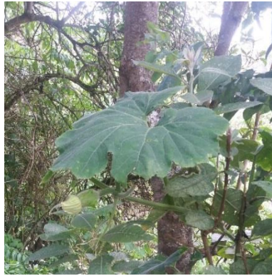
Flor de Chiclayo ( cucúrbita ficifolia )