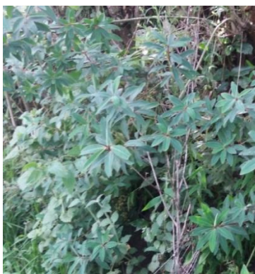
Hojas de dos carillas ( vernaculo )

Para esto se hace uso de las hojas dos carillas, hojas de undul, hojas de laurel, ciogue blanco hojas de llantén y salvia blanca, teniendo todos los materiales preparados se procede a mezclar las plantas en un recipiente amplio con 5 litros de agua hervida y se tapa con una manta por 20 minuto, pasado el tiempo se pide a la persona que se incline por tres oportunidades denominado así baño de vapor. Este procedimiento solo se realizar por las noches durante tres días y se tiene que tener en cuenta que el baño de vapor no debe durara por más de 10 minutos y guardar repodo.