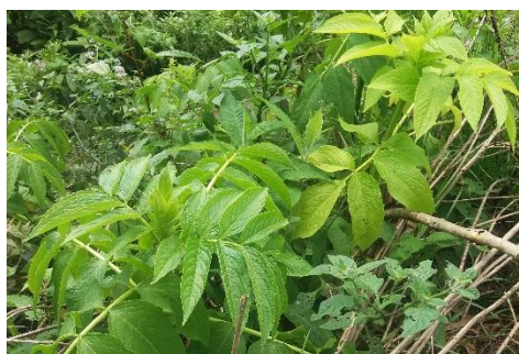
Flor del sauco ( sambucus )

Se utiliza la flor del sauco y hojas de llantén, luego en un vaso de agua hervida se coloca la flor de sauco 3 hojas de llantén y se deja que se saune por 10 minutos, una vez preparado se toma un vaso por la noche lo cual surgirá efectos inmediatos.