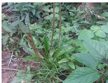
Hojas de salman ( vitis vinifera )

Se utiliza las hojas del salman, un puñado de harina blanca, puñado de pasca, una vez preparado estos materiales se empieza a mezclar sobando la pasca más la harina blanca y las hojas del solman, preparada la mezcla en medianas cantidades se aplica en la zona afectada por 7 días. Terminado el tratamiento se tiene que tener en cuenta que la mezcla no se debe dejar por más de 5 minutos ya que lastimaría mucho más la piel dañada.