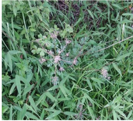
Figura 08. Hojas del mutuyo ( ecjinacea angustifolia )