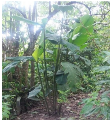
Achira negra ( canna )

Se utiliza la hoja de la achira negra, manteca de chanco y se agrega el aguardiente, esta combinación se mezcla en la hoja de la achira negra, una vez ya preparado se coloca en el estómago de la persona en forma de un emplasto, pero en una pequeña cantidad. Este tratamiento solo se aplica por la noche.