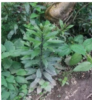
Hierba santa ( piper auritum )

Se utiliza hojas de hierba santa, las hojas del pashquete rojo más la harina blanca y aguardiente, luego se hace una mezcla sobando las hojas de la hierba santa más la hojas del pashquete rojo y se agrega harina, trago una vez sobado presenta una consistencia semisólida, lo cual se aplica en forma de un emplasto. Este tratamiento se aplica en el estómago y la frente y se deja ahí hasta que se seque completamente.