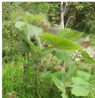
Hojas de pashquete ( bijau o bijahua )

El emplasto solo se coloca en el estómago y la frente hasta que se seque completamente. (Poblador 2)