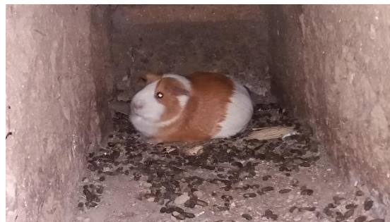
Cuy ( cavia porcellus )

Se usó de un cuy mediano, además remedios como la timolina, agua de nanga, vinagre alcanforado harina blanca y la coca chactada, su modo de preparación es realizar una mezcla primero con la harina blanca y se agrega 7 gotas de timolina, 7 gotas de agua de cananga, 7 gotas de vinagre, 7 gotas de alcanforado y se agrega la coca chactada, para luego con el cuy empezar a pasar por todo el cuerpo de la persona terminada la limpia se procede a sacrificar al cuy con la uñas abriéndolo por completo y de esa forma observar que parte de su organismo está afectado para empezar si con su tratamiento, la limpia siempre se tiene que realizar por la noche dos veces durante la semana en los días martes y viernes que son días astrológicos. Con este tratamiento la persona tiene que guardar reposo y no comer frituras ya que arrancaría su limpia.