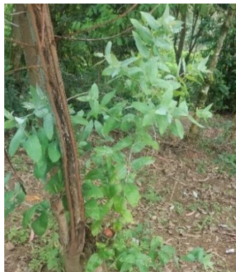
Eucalipto tronjil ( eucalyptus )

Se utiliza el agua hervida además de eucalipto toronjil, esto se realiza primero con el agua hervida en un recipiente y con una prenda se mueve el agua para que se active el vapor para eso la persona se tiene que acercarse para inhalar todo el vapor, esto se realiza por la noche hasta tres oportunidades, teniendo en cuenta de que la persona no tiene que presentar fiebre ya que agravaría su enfermedad. Una vez terminado este procedimiento se prepara la infusión que consiste en colocar 2 hojas de eucalipto toronjil en un vaso de agua hervida y dejar por 10 minutos que se saune y beberlo caliente. Terminado este procedimiento la persona tiene que guardar reposo y abrigarse al instante.