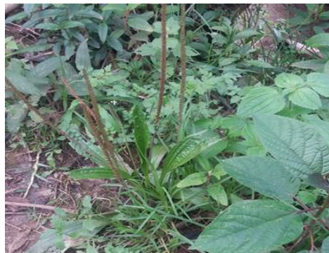
Figura 12. Hojas de salman ( vitis vinifera )