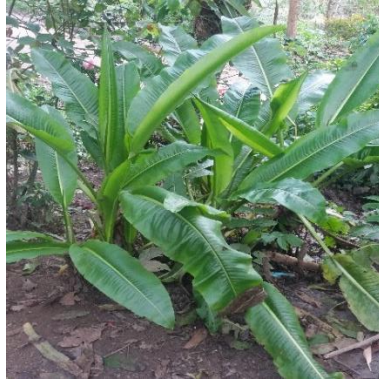
Hojas del mutuyo ( ecjinacea angustifolia )

Se hace una mezcla sobando en el agua tibia con todas las ramas y se frota por todo el cuerpo de la persona además se agrega siete espíritus más la coca (poblador 6)