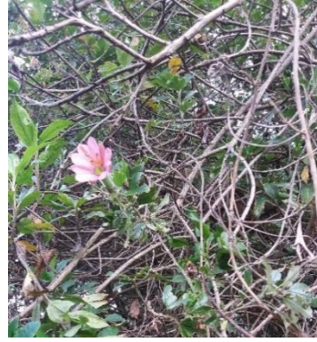
Hoja de durazno ( prunus persica )

Se soba [el preparado el hojas...] en agua hervida en una tina con un aproximado de 10 litros de agua y se echa un puñado de harina (poblador 8)