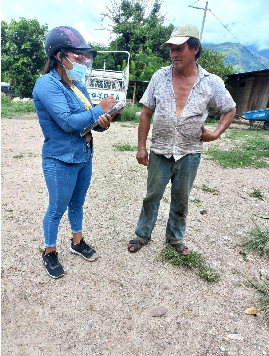
Aplicando cuestionario a beneficiario en caserío San Cristóbal.