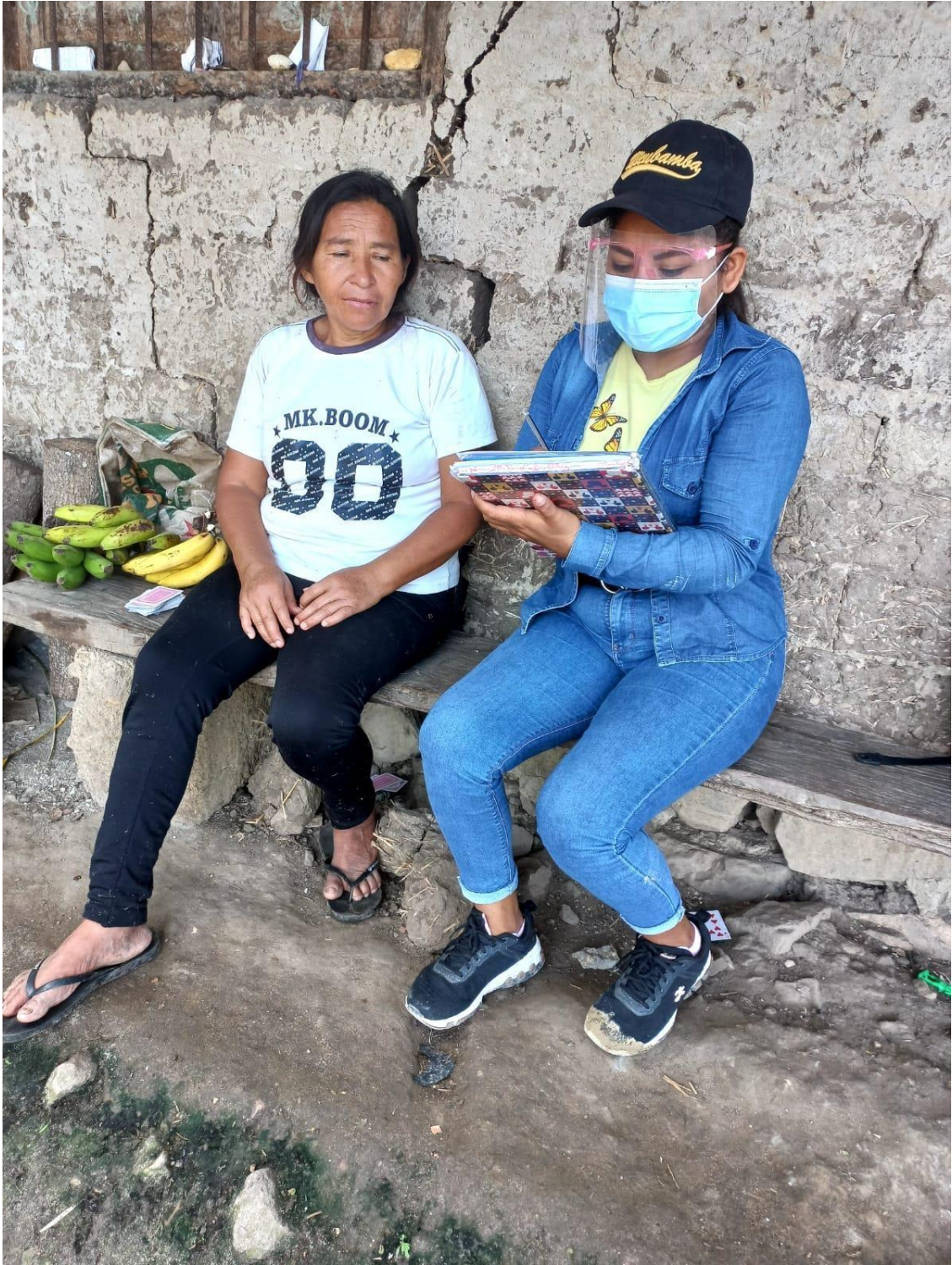
Aplicando cuestionario a beneficiaria en su domicilio del caserío Sirumbache.