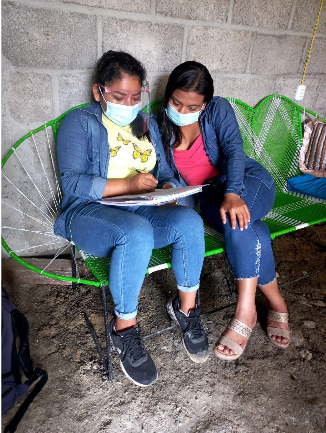
Aplicando cuestionario a beneficiaria en domicilio del centro poblado Madre de Dios.