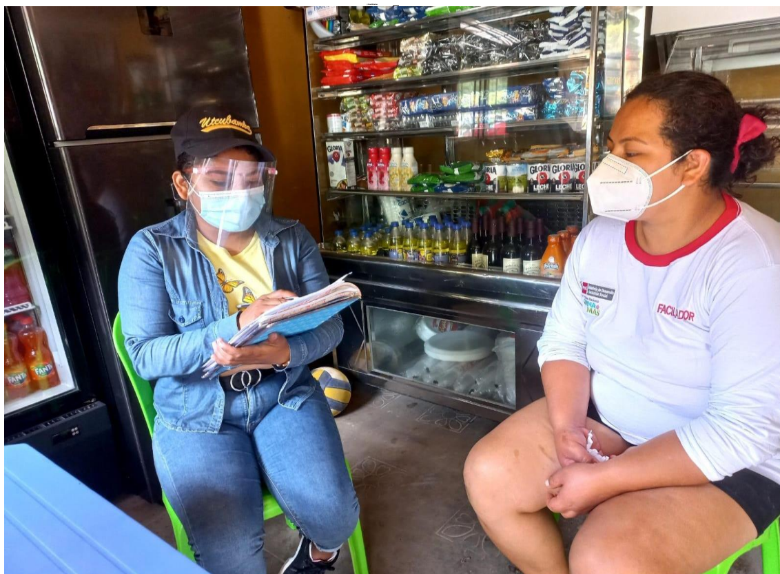
Aplicando cuestionario a beneficiaria en domicilio del centro poblado Madre de Dios.