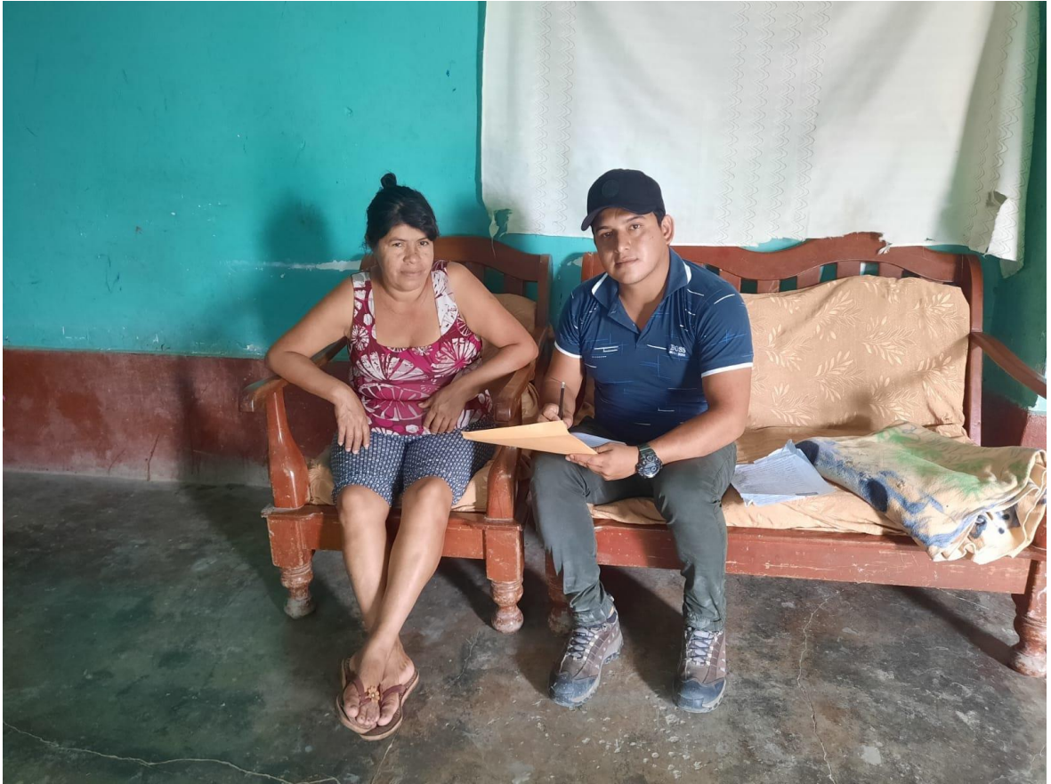
Aplicación de encuesta a productora en su domicilio del centro poblado San Juan de La Libertad