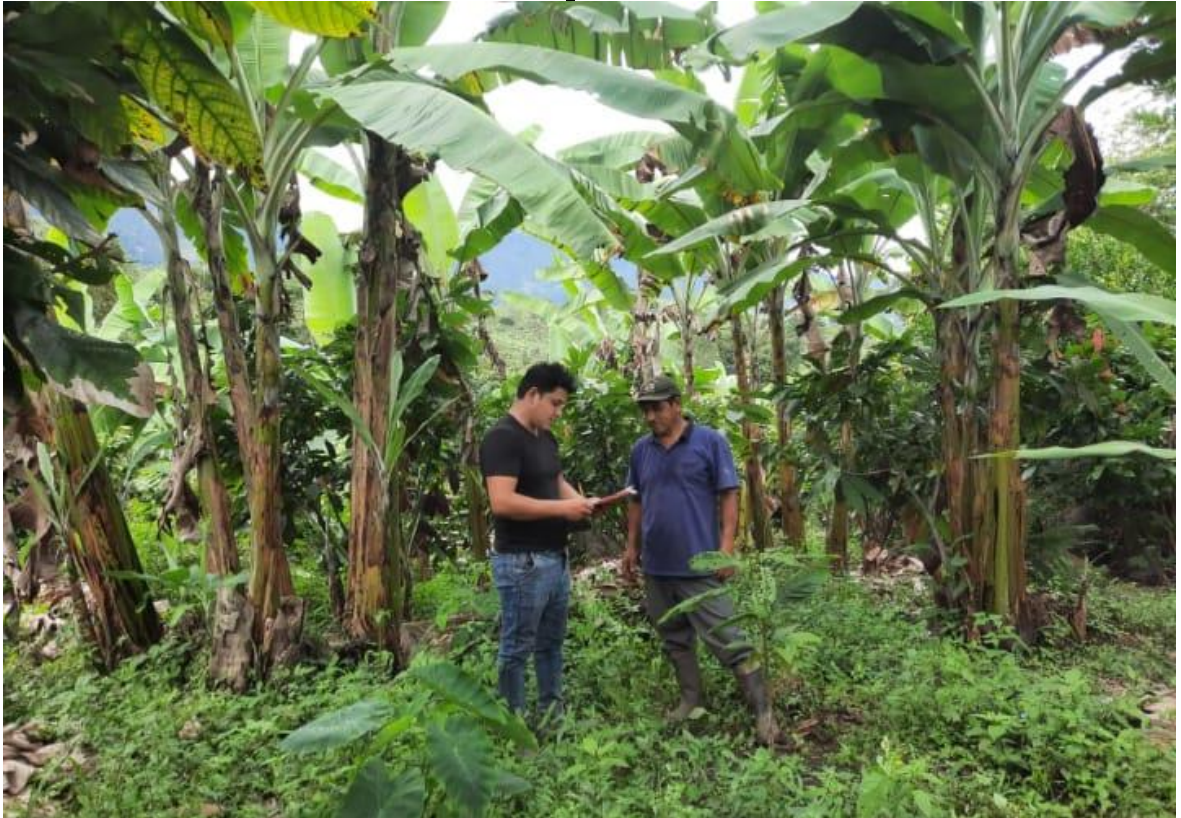
Aplicación de encuesta a productor en su parcela de banano – Caserío Seda Flor