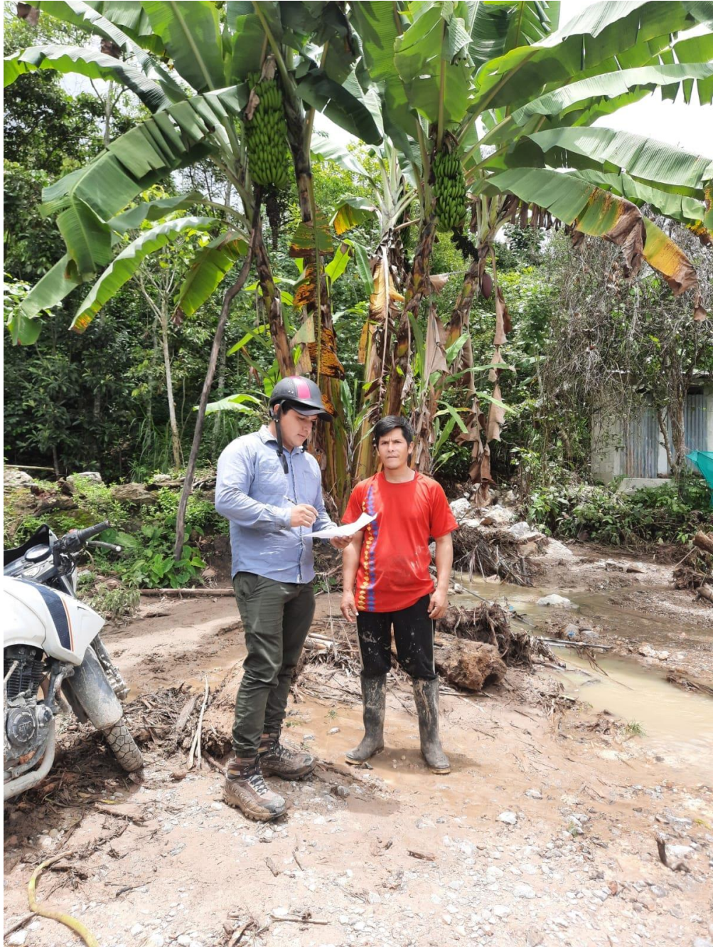
Aplicación de encuesta a productor en su parcela y domicilio del caserío Seda Flor