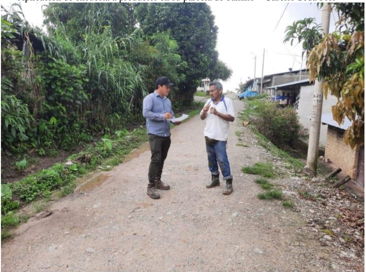
Aplicación de encuesta a productor en centro poblado San Juan de La Libertad